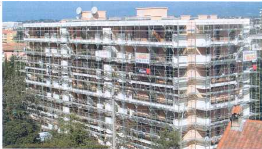
Ravalement en cours sur l'un des 11 bâtiments de la résidence «Les Imperators».

► L'entreprise de peinture/ravalement Valenti (1,2 million d'euros de chiffre d'affaires, 20 salariés), PME trentenaire basée à Fréjus et spécialisée dans les travaux de copropriété, s'attaque au plus